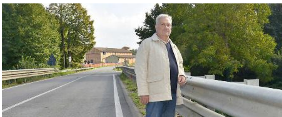
I TIMORI Il ponte sulla Cassia Ci passano ogni anno tre milioni di veicoli