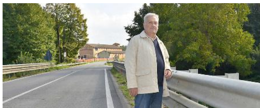
I TIMORI Il ponte sulla Cassia Ci passano ogni anno tre milioni di veicoli